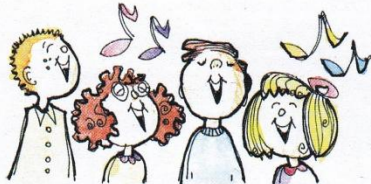
PJEVAMO PJESME DOŠAŠĆA ILI ADVENTA.