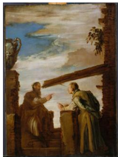
Domenico Fetti: parabola o trunu i brvnu

Znamo da smo svi mi ljudi činimo grijeha i zlo i da nitko od nas nije bez grijeha. No, često se nastojimo ponašati kao da mi nemamo grijeha ili ih pokušavamo sakriti od drugih. Puno lakše uočavamo pogriješke drugih i počesto ih naglašavamo. Isus nas želi poučiti da prvo gledamo svoje grijeha i popravljamo ih, a tek onda ćemo vidjeti da drugi nisu toliko grješni kao što mi mislimo.