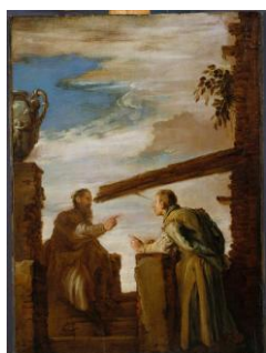
Domenico Fetti: parabola o trunu i brvnu