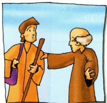
1. Otac Tobiji tumači

1. Ispod svakog crteža napiši riječi koje nedostaju i o kojima govori crtež.