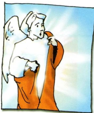
4. Rafael se otkriva kao

2. Zaokruži točan odgovor. Koliko puta anđeo Rafael, nakon što se otkrio, govori hvalite Boga?