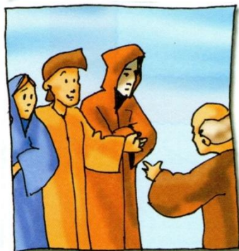
3. Tobija se vratio kući s