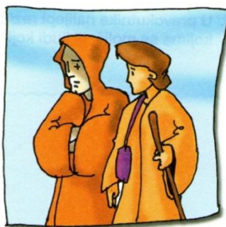
2. Tobija je našao svoga