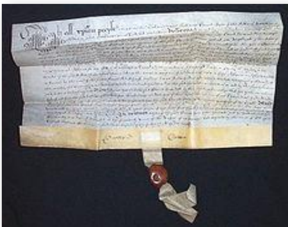
Tekst na pergameni