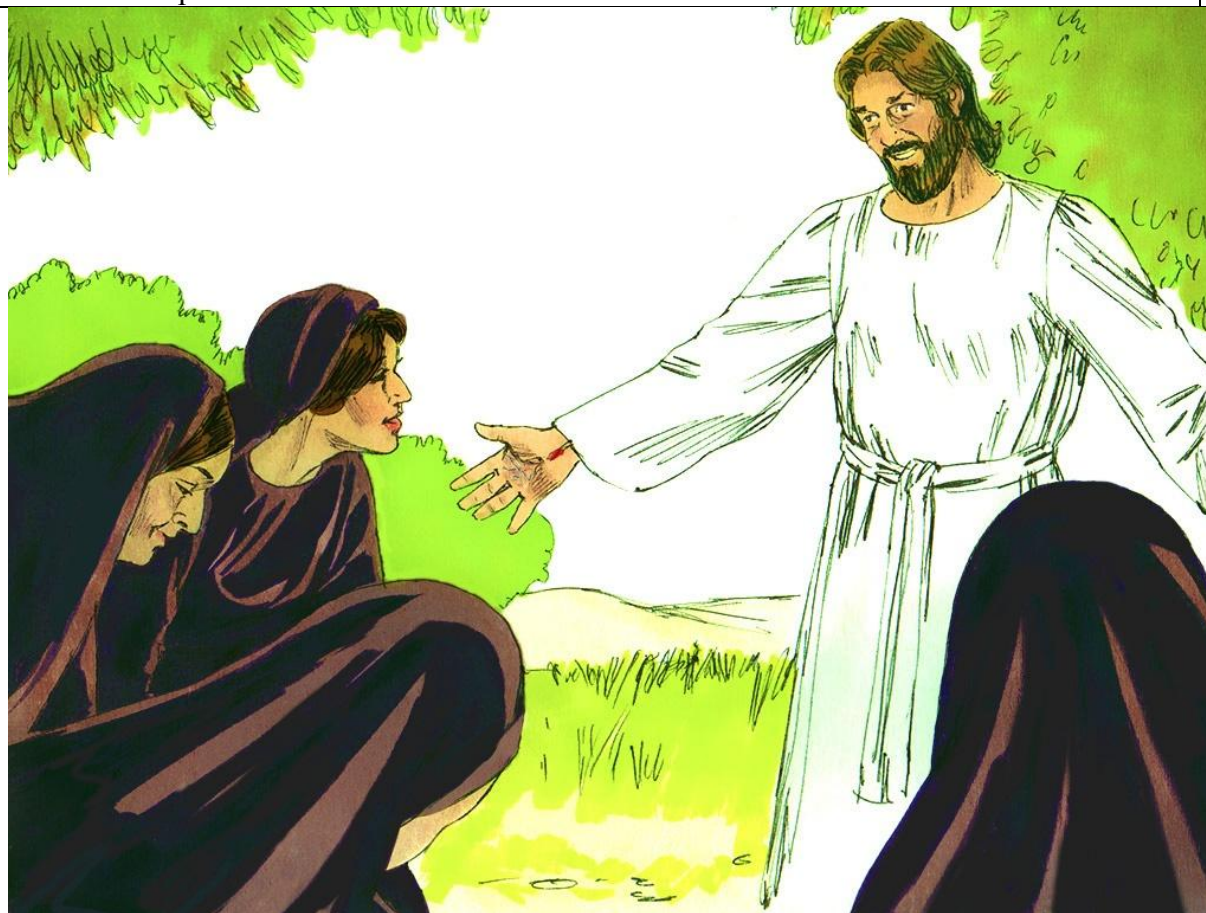
Žene susreću uskrslog Krista