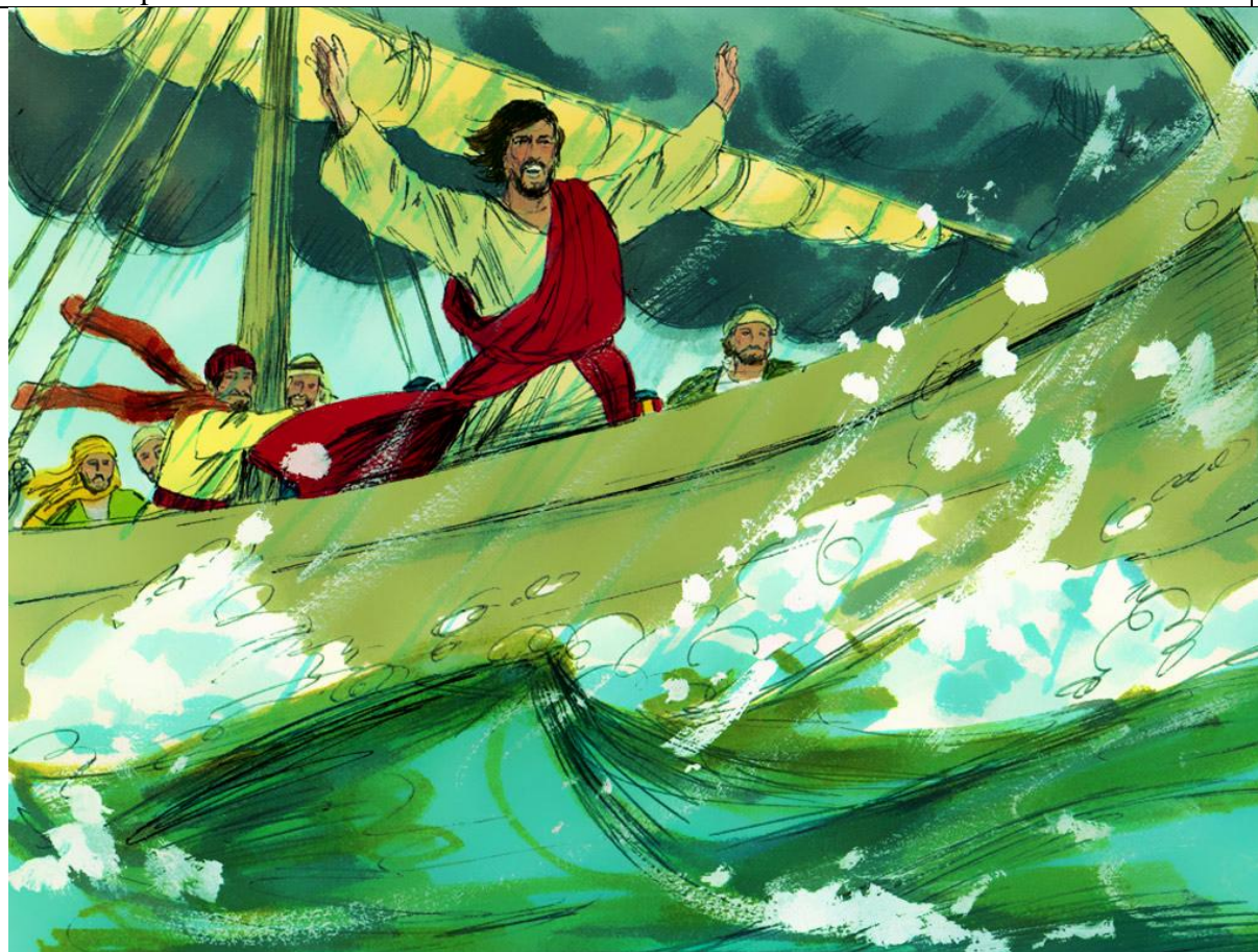
Isus smiruje oluju