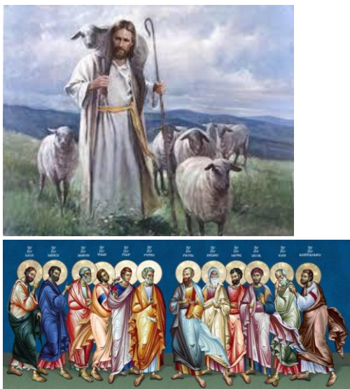
(PPT Dobri pastir i apostoli)

Igra otkrivanja polja. Učenici su podijeljeni u skupine. Svaka skupina ima svog glasnogovornika. Imaju pravo otkriti jedno polje i ponuditi rješenje, ako ga ne znaju druga skupina otvara polje.