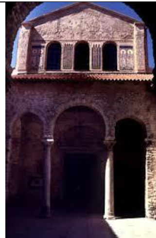
14. POREČKO - PULSKA