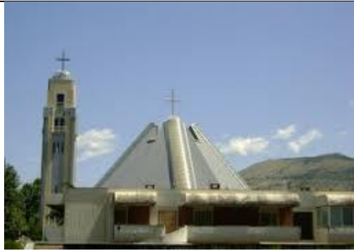
19. MOSTARSKO - DUVANJSKA