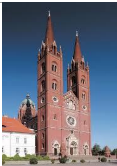
5. ĐAKOVAČKO - OSJEČKA