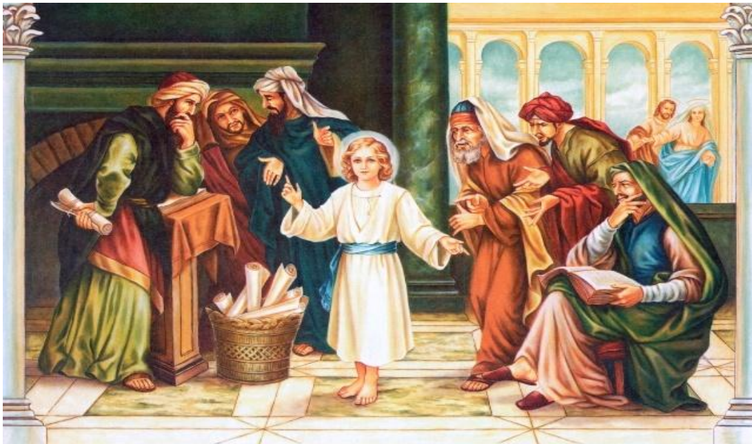
Dvanaestogodišnji Isus među učiteljima u Hramu