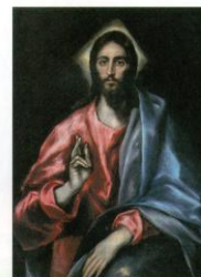
El Greco, Krist Spasitelj

Isus dođe u Nazaret, gdje bijaše othranjen. I uđe po svom običaju na dan subotnji u sinagogu te ustane čitati. Pruže mu Knjigu proroka Izaije. On razvije knjigu i nađe mjesto gdje stoji napisano: