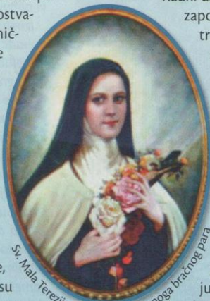
Sv. Mala Terezija – slavna kći blaženoga bračnog para