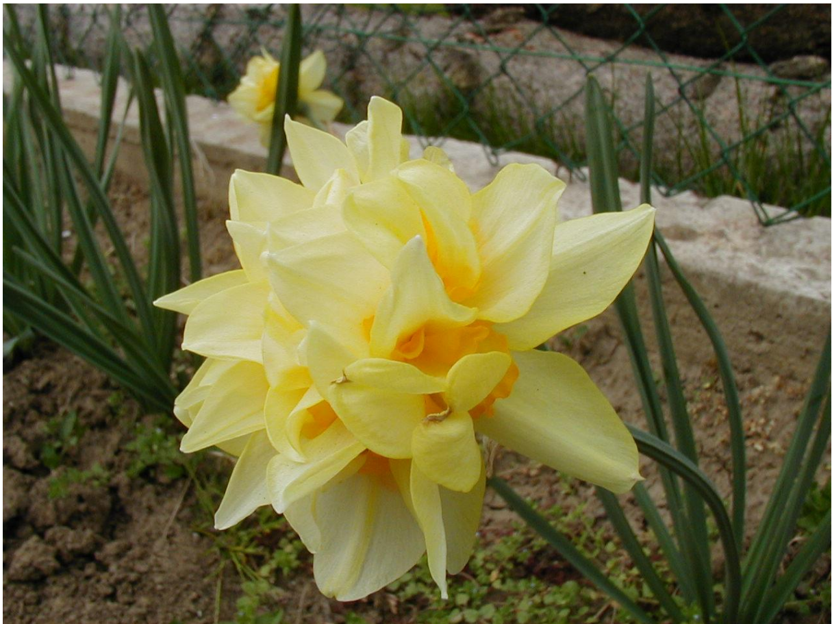
Prilog br. 3 - Radni listić USKRS - USKRSNI SIMBOLI