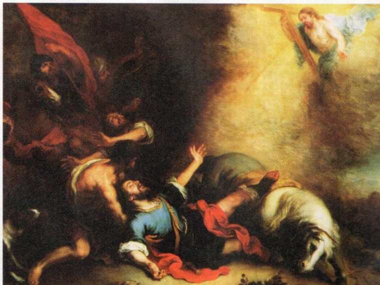
Bartolomé Estebán Murillo, Obrćenje svetoga Pavla , 17. stoljeće, Madrid