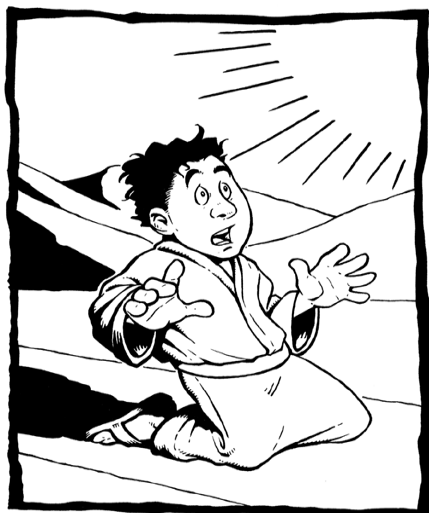
PAUL Acts 9:1-19

Pavlov rodni grad je TARZ , a JERUZALEM je grad njegove mladosti i školovanja.