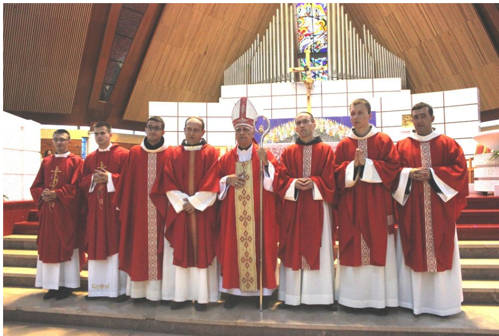
Katolički svećenici s biskupom

Katoličanstvo je prevladavajuća vjeroispovijed u većini Europe, Latinskoj Americi i Filipinima, te velikim dijelovima Sjeverne Amerike, subsaharske Afrike. Procjenjuje se da u svijetu ima približno 1,2 milijarde katolika.